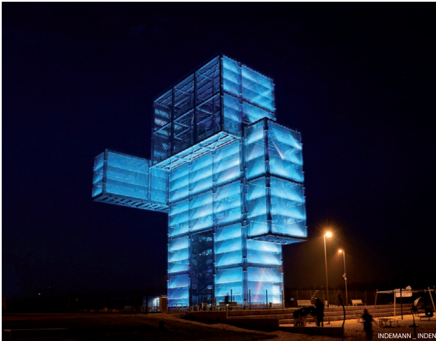
INDEMANN _ INDEN

Wir sind Kommunikationsprofis. Wir beraten, entwickeln Strategien und konzipieren zielführende, kreative Kommunikationslösungen für Unternehmen und nicht erwerbswirtschaftliche Organisationen.